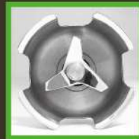
Cuchilla templada de acero inoxidable.