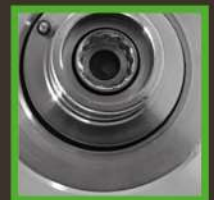
Brazo de transmisión templada.