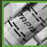
Ventilación en cuerpo de motor.