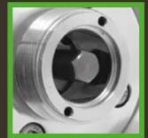
Fácil acoplamiento entre motor y brazo.