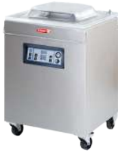
EVD-48 Bomba de vacío 40 m 3 /hr