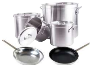
Ollas y sartenes