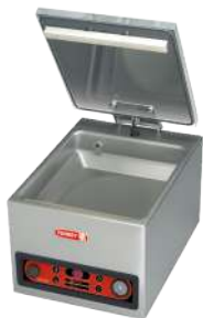
EVD-4 Bomba de vacío 4m 3 /hr