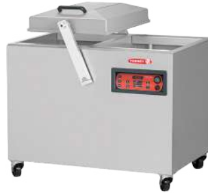
EVD-2C76 Bomba de vacío 63 m 3 /hr