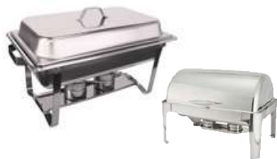
Chafers clásico / lujo