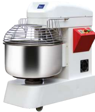
A-46 / A-66