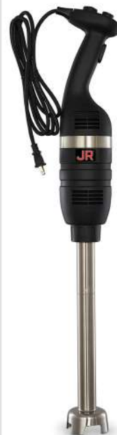
TRI-350 Motor de 350 watts