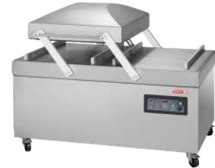
EVDA-2C160 Bomba de vacío 160 m 3 /hr