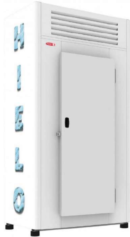
Conservador de Hielo