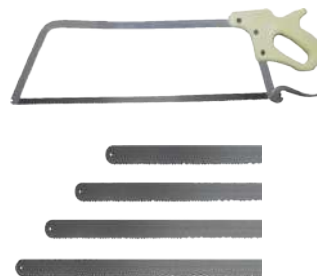
Arcos y seguetas