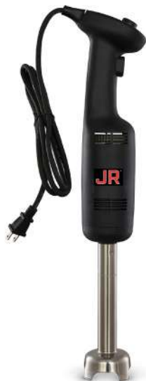
TRI-270 Motor de 270 watts