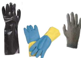
Guantes para todo tipo de uso