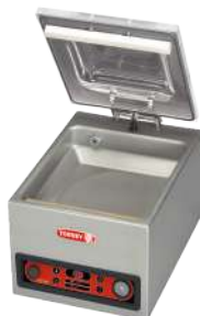
EVD-8 Bomba de vacío 8m 3 /hr