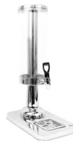
Dispensador de jugos