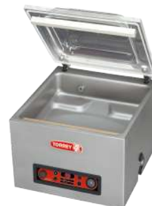
EVD-20 Bomba de vacío 16m 3 /hr