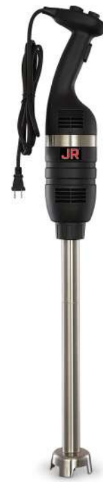
TRI-550 Motor de 550 watts